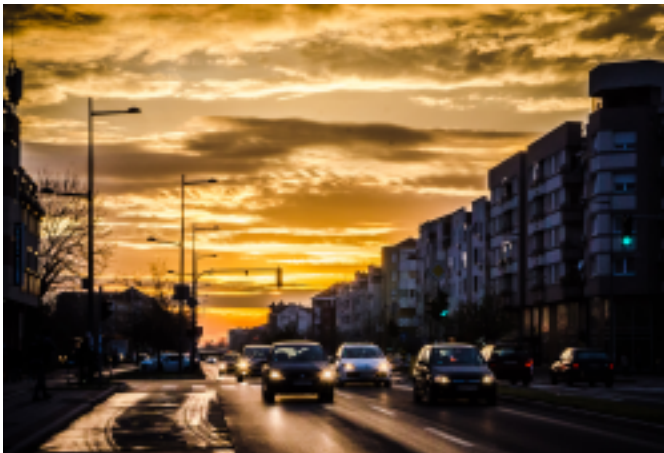
Гордана Јовић Атлагић