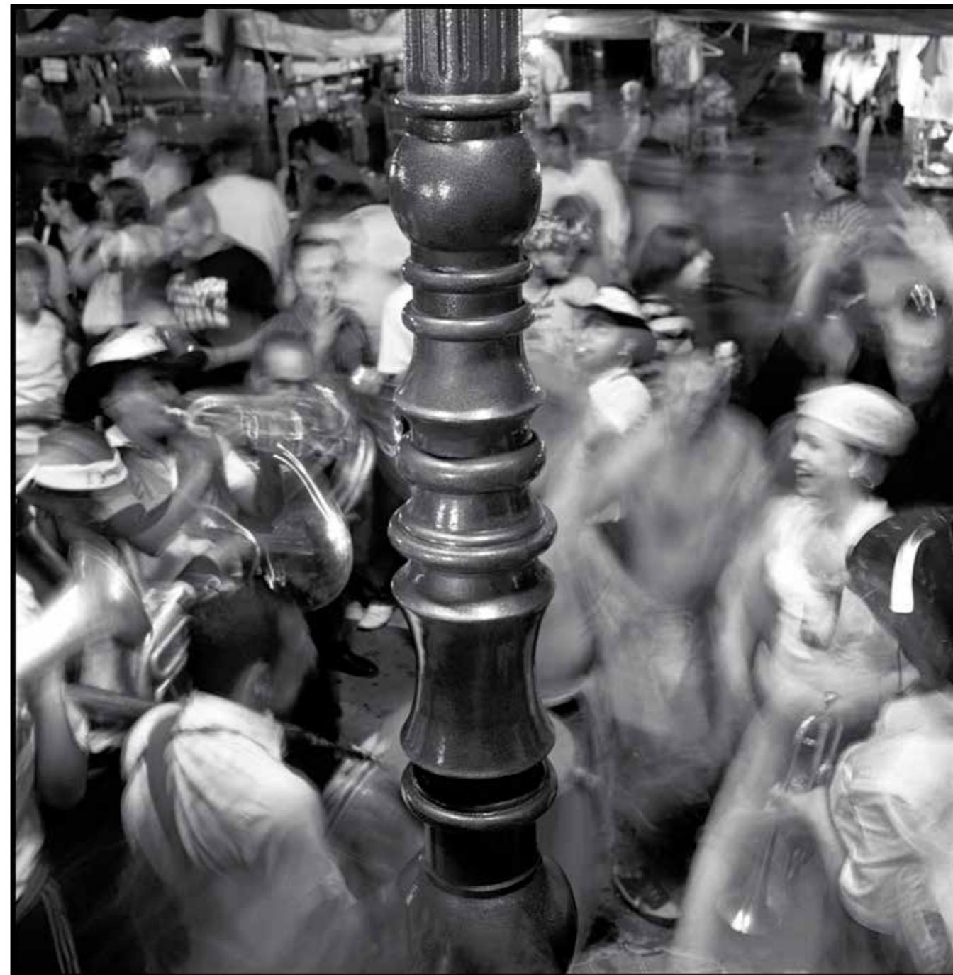
Добре вибрације, Гуча, 2009.