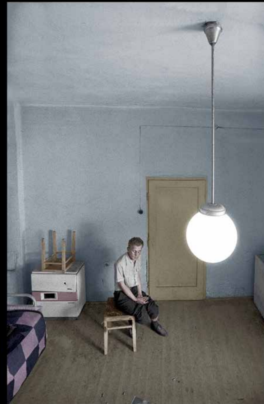
Дуле Пацов, Соба и лустер, 1988. накнадно колорисано