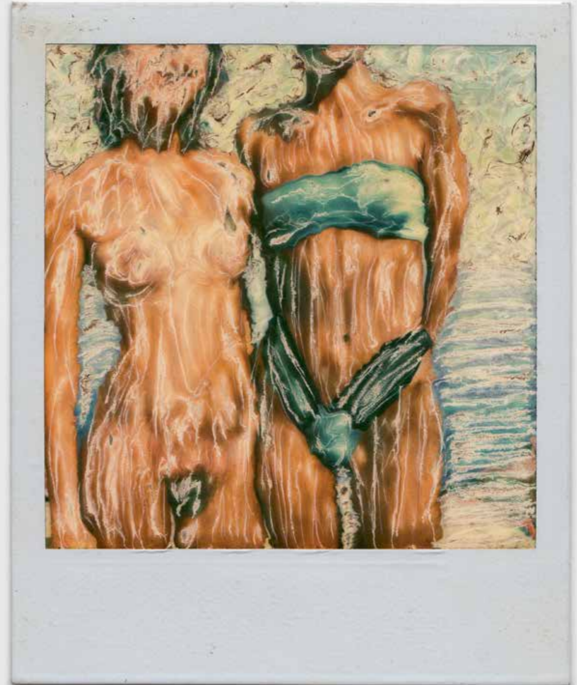
Локрум: Рита+Тинде, 1988.